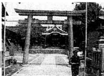
No.205 甲子園スサノオ神社