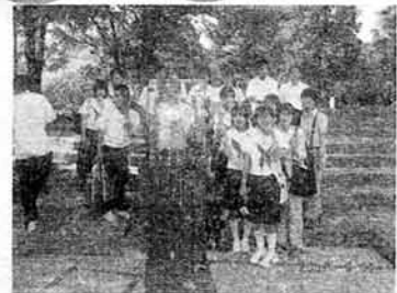
2007/5/31 宇部市立藤山中学校 生徒160名参加。