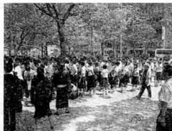
2007/5/31 岐阜市立藍川中学校 生徒200名参加。