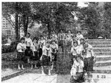
2007/5/23 宇部市立西岐波中学校 生徒220名参加。